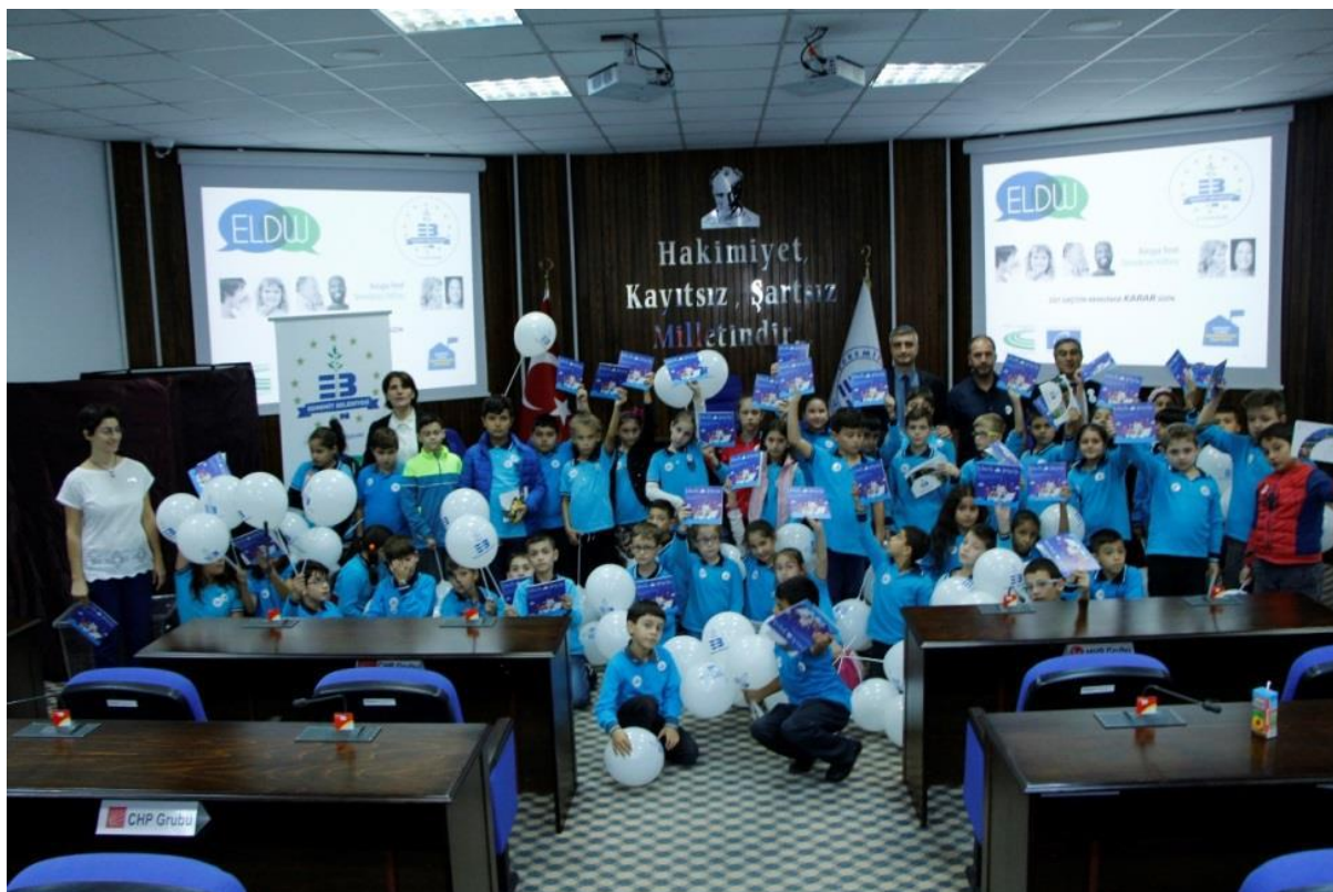
Gyermekek tapasztalják meg a demokráciát Edremitben (Törökország)